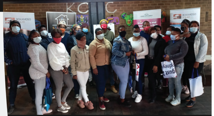
Lenaneo la Tlhabololo ya Bašwa le tla tswelela go ralala ngwaga wa 2022, le tsosolosa bašwa ba ba mo baaging ba Kanana le Kgakala.

"E ne e le nngwe ya dithuto tse di botoka go gaisa tseo ke kileng ka di ruta. Baihuti ba ne ba itumeletse diroboto, e bile ke bone ditlhophha tse di farologaneng di dira mmogo go samagana le dikgwetho."